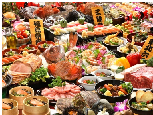
ビュッフェレストラン提供メニュー（イメージ）

今後も展望大浴場のリニューアルも実施するなど、新しい丸峰に向けて積極的な投資を実施し、魅力向上を図るとともに、会津地域との結びつきを深め、ホテルはもとより地域全体の魅力向上に励みたいと存じます。引き続きのご支援とご愛顧を賜りますようお願い申し上げます。