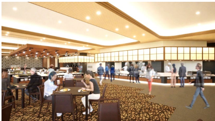
ビュッフェレストラン（イメージ）

また、直近の更なる施策として、3月1日には、ビュッフェレストラン「麗峰（れいほう）」の新設オープンを予定しております。ビュッフェレストラン「麗峰」の料理は、地元会津や福島の豊富な食材を中心に、みちのりグループのチャネルを生かした新鮮な三陸の海の幸グルメや東北6県の魅力を集めた料理を提供します。また、お客様の目の前で調理するライブキッチンの臨場感もお楽しみいただけます。さらには、内装やスタッフのユニフォームも「SAMURAI CITY」＝会津若松市のコンセプトにフィットしたものとしました。これらを通じて「食」の楽しみをダイナミックにご堪能いただける空間とサービスを提供いたします。